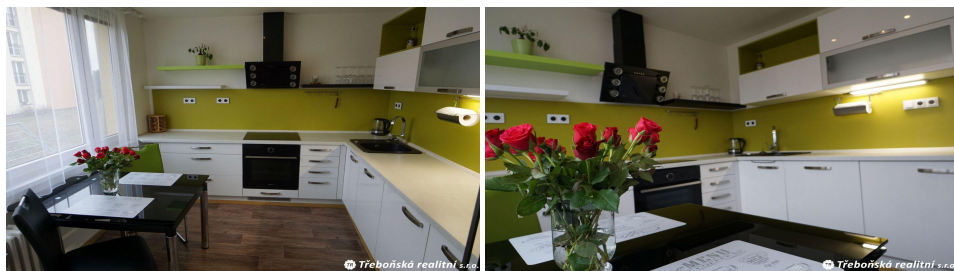
BYT 2+1, CHLUM U TŘEBONĚ